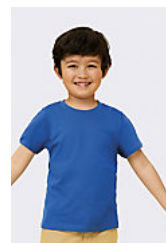
SOL'S REGENT KIDS 11970