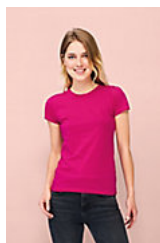
SOL'S MISS 11386