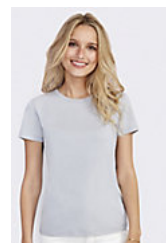
SOL'S REGENT WOMEN 01825