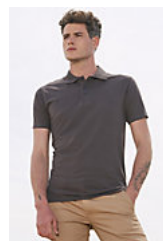
SOL'S PRESCOTT MEN 11377